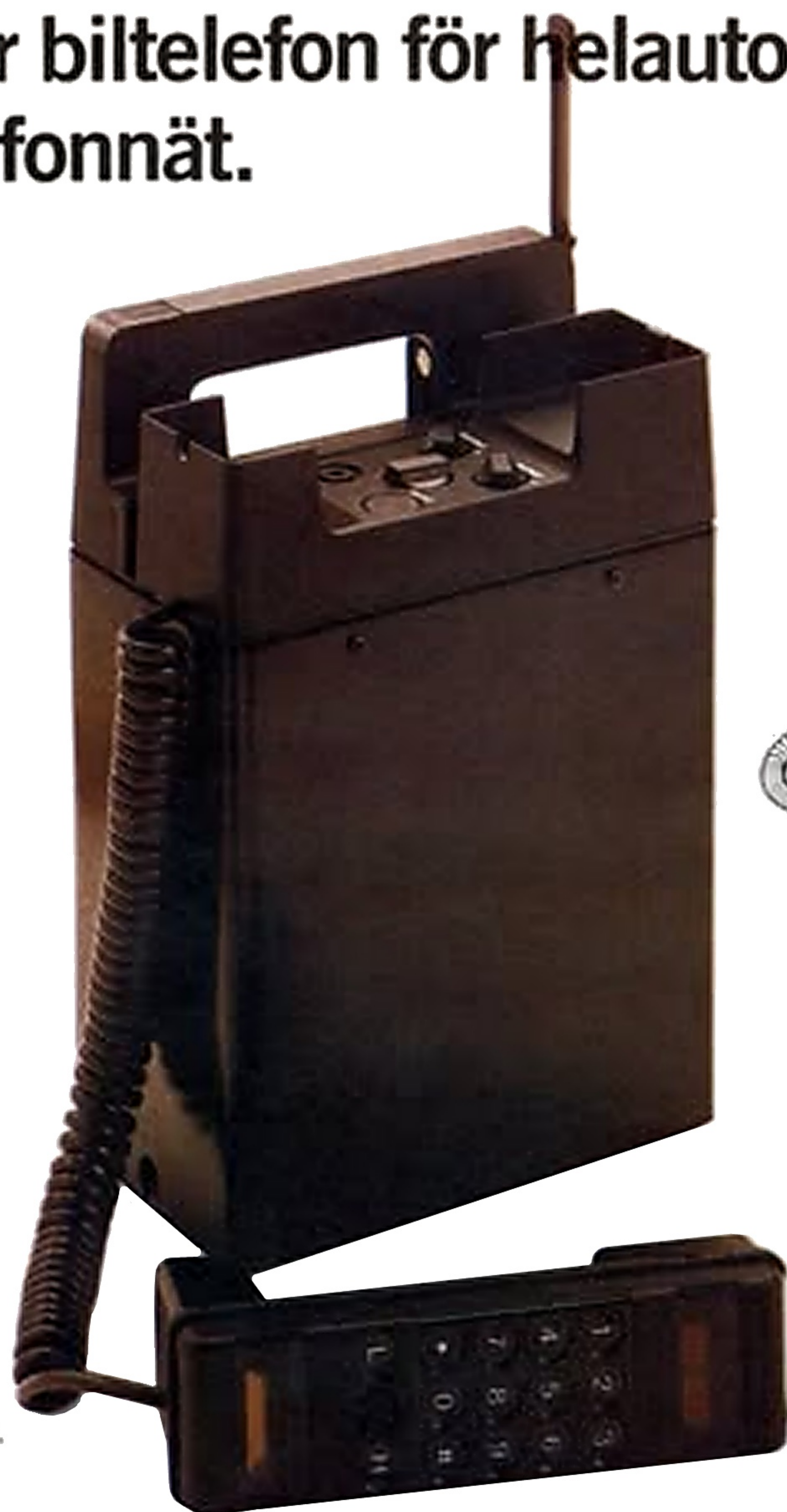
C 600 Roadcom P utan batterikassett.